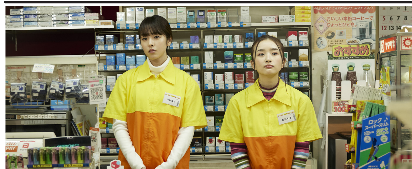
LA FILLE DU KONBINI

Cinéma indépendant - Art & Essai - Labellisé Jeune Public et Patrimoine et Répertoire - du 06 mai au 02 juin.